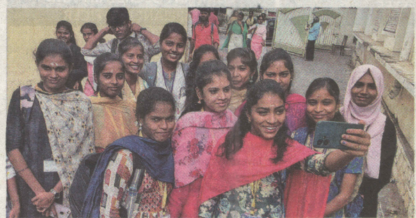
↑ கோடை விடுமுறை முடிந்து, கோவை அரசு கலை அறிவியல் கல்லூரியில் நேற்று வகுப்புகள் தொடங்கின. கல்லூரி நுழைவு வாயிலில் செல்ஃபி எடுத்து மகிழ்ந்த இரண்டாம் ஆண்டு, மூன்றாம் ஆண்டு மாணவிகள்.